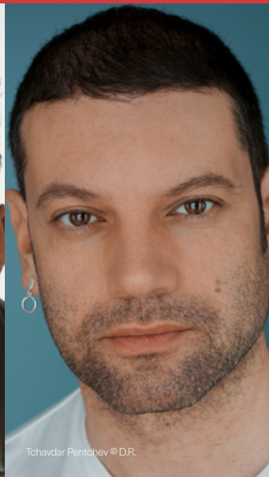
Tchavdar Pentchev © D.R.