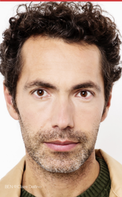
BEN © Claire Delfino