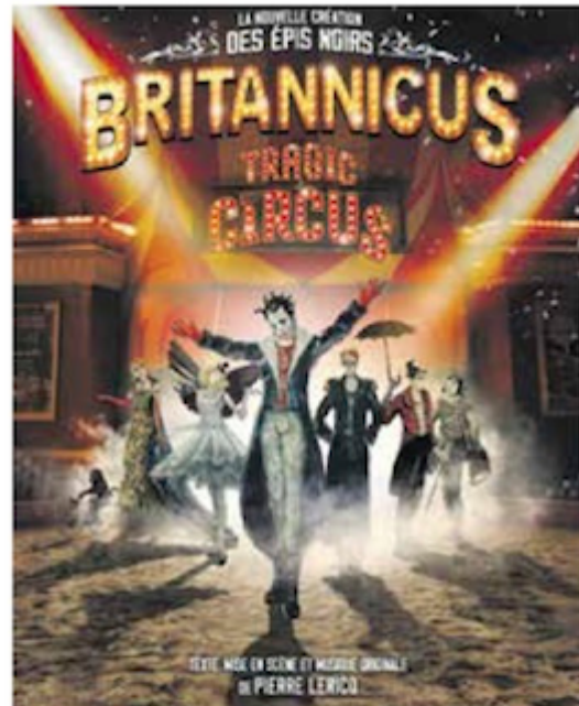
Britannicus de la compagnie Les Épis Noirs.