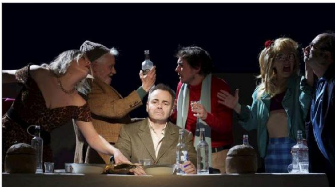
Sémione rêve de jouer du bombardon et de devenir riche.

C'est la première mise en scène de Julie Cavanna qui s'attaque à un texte ambitieux, Le Suicidé , du dramaturge Nicolaï Erdman, une œuvre de 1928 qu'elle a adaptée en décontextualisant la pièce de sa Russie d'origine.